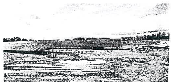
Fillé, juillet 2014. Les panneaux photovoltaïques sont en cours d'installation. Ils seront opérationnels dès le mois de septembre.

Au printemps 2015, la commune de Fillé sera rejointe par Allonnes où deux champs solaires sont en cours de réalisation. Un projet plus ambitieux puisque 27 000 panneaux y seront installés sur deux parcelles, l'une de 10 hectares, l'autre de 6 ha. Des super-panneaux munis de trackers « mobiles et capables d'aller chercher